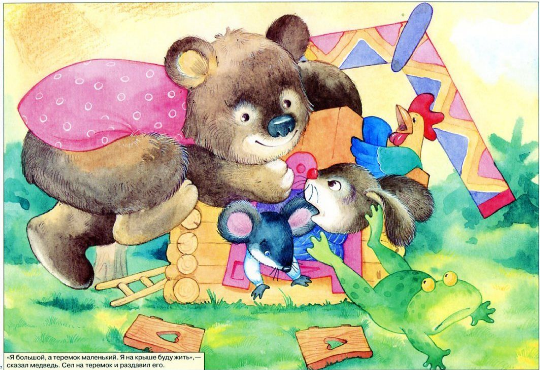
«Я большой, а teremok маленький. Я на крыше буду жить», — сказал медведь. Сел на teremok и раздавил его.