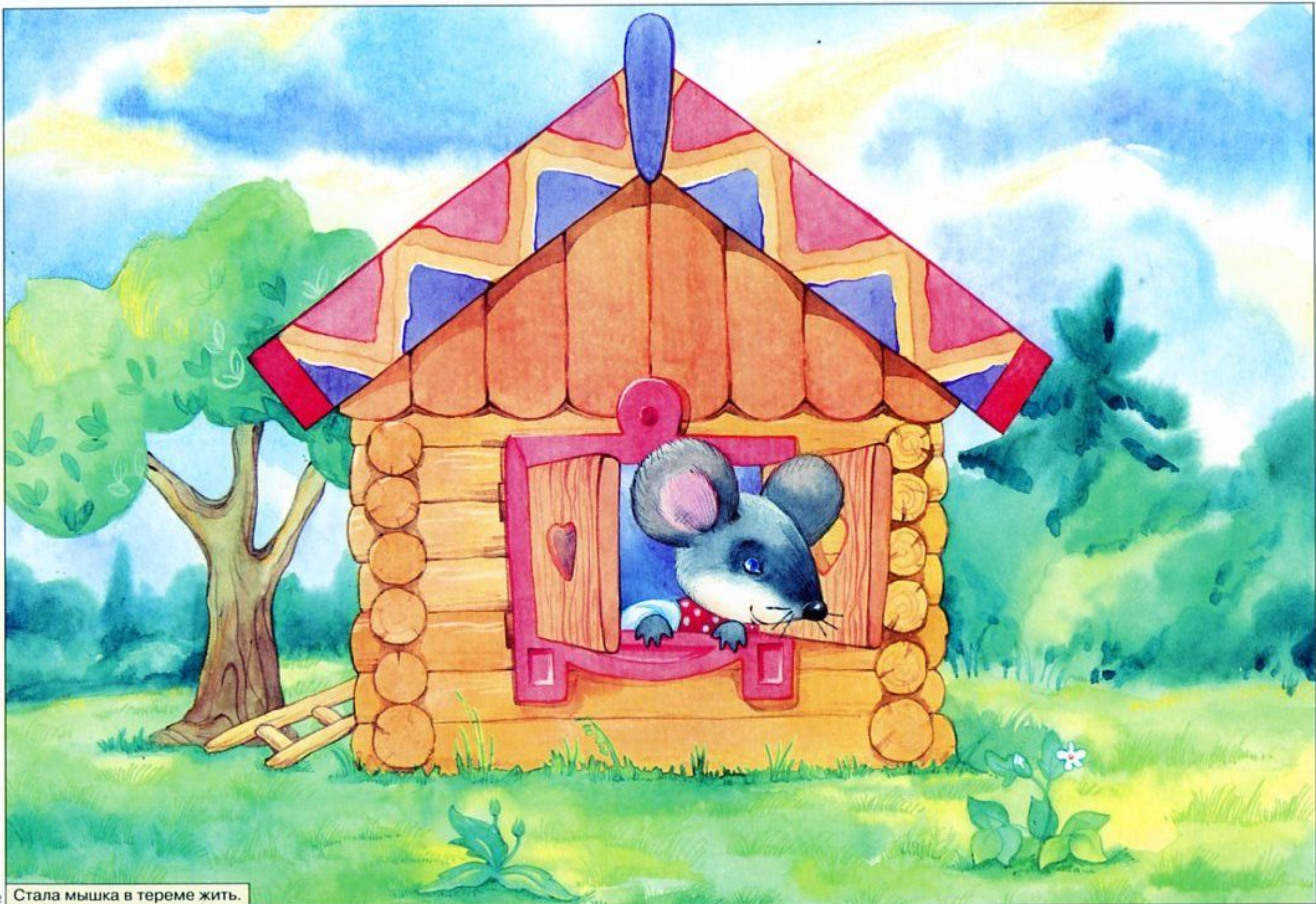
2 Стала мышка в тереме жить.